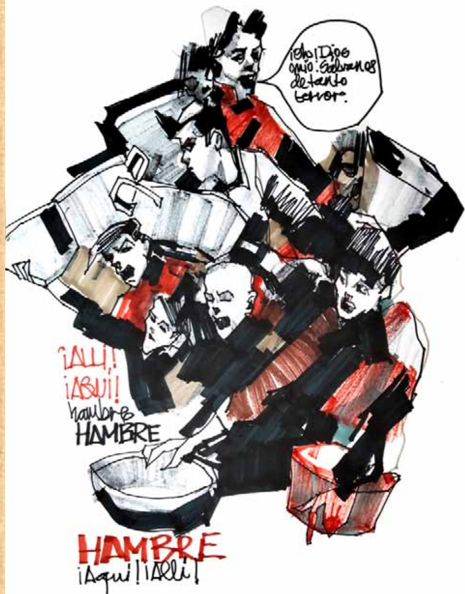
The relentless human beast