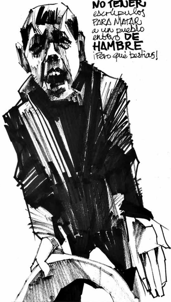
A death from hunger

Hace falta NO TENER escrúpulos PARA MATAR a un pueblo entero DE HAMBRE ¡Pero qué bestias!