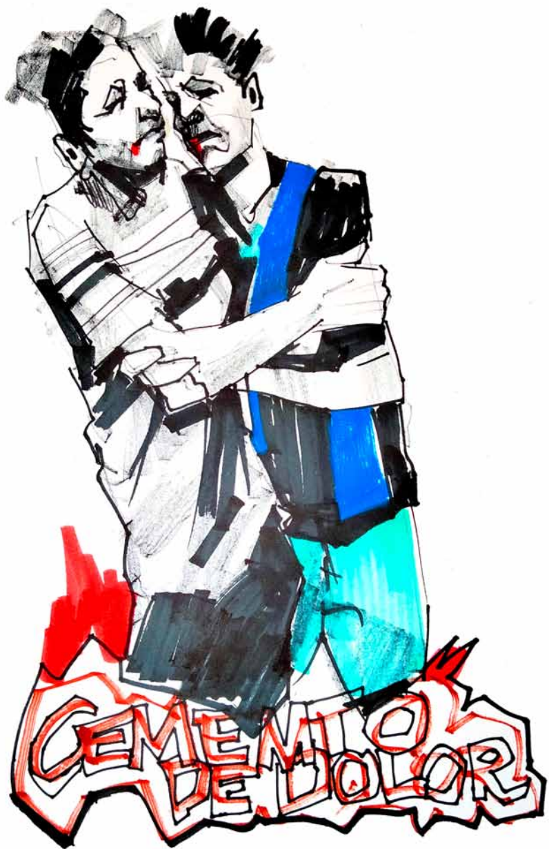
Cement of pain