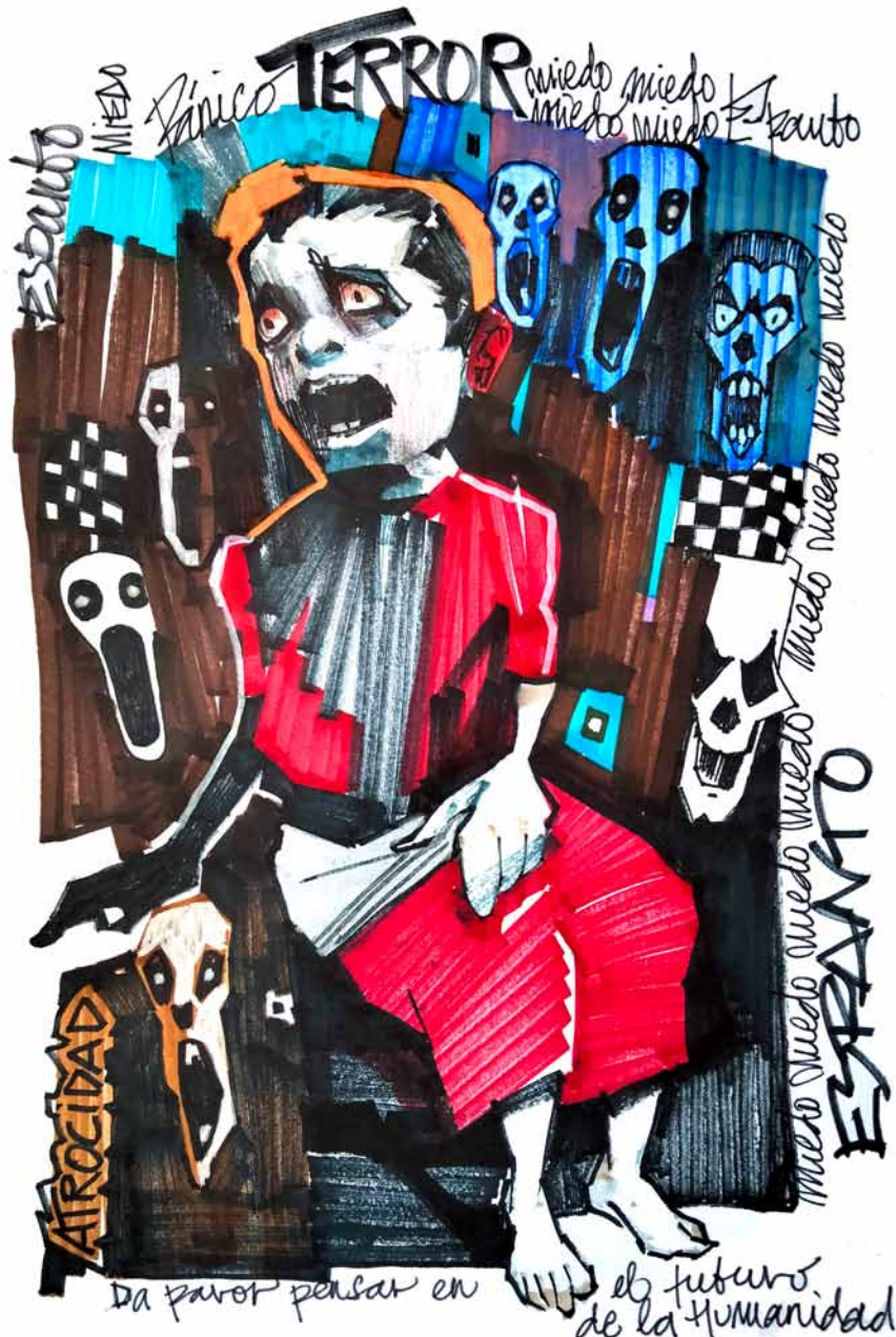
The human terror