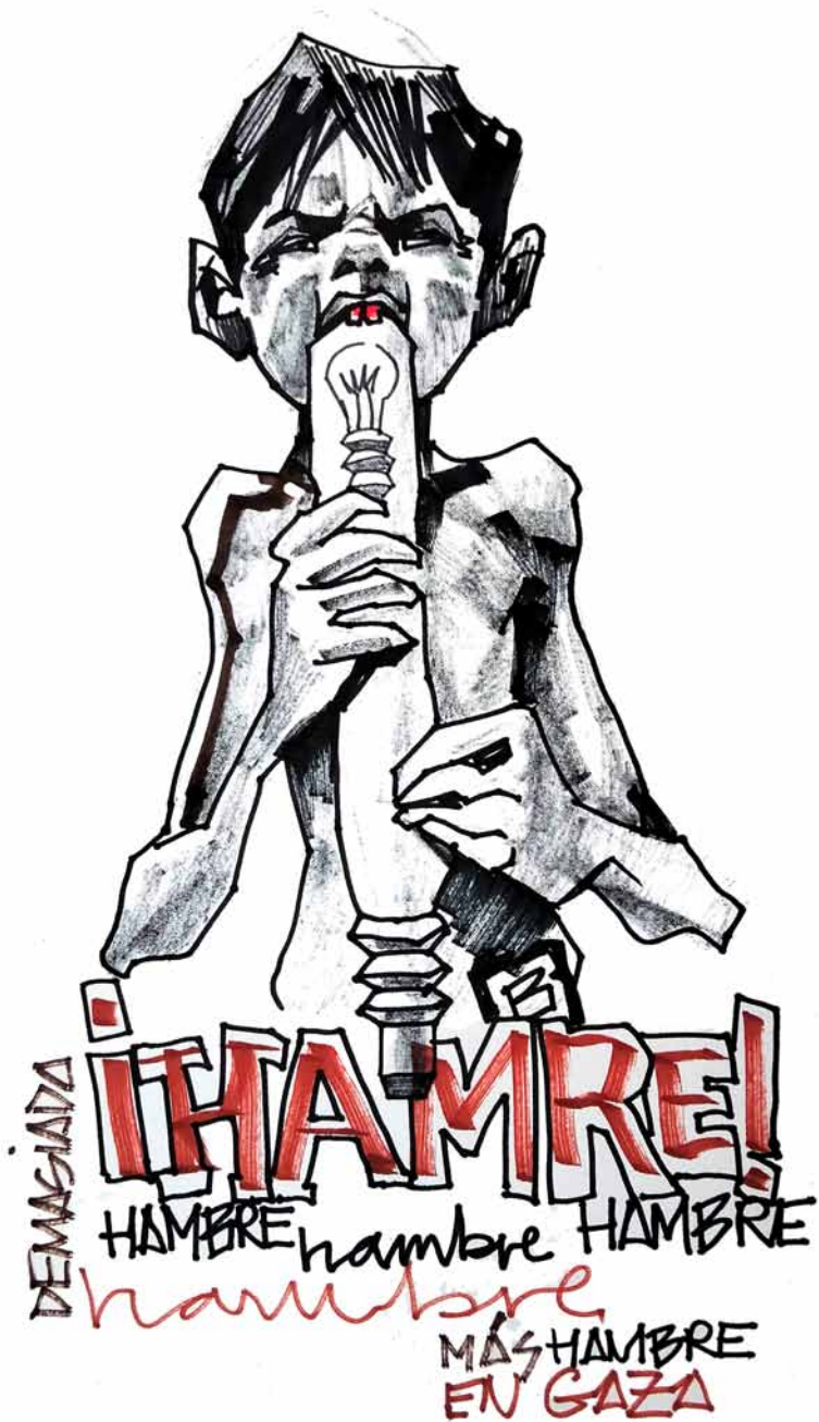
Hunger, famine, starvation