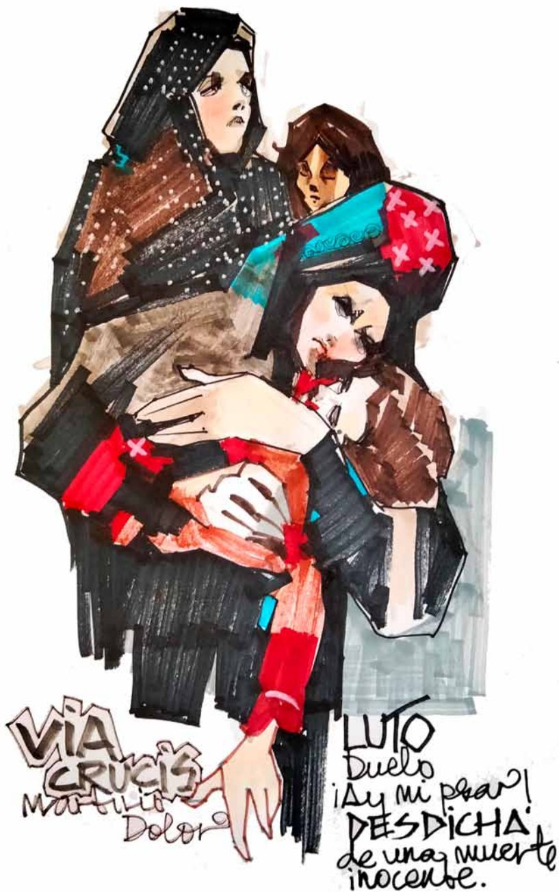
Misfortune and innocent death