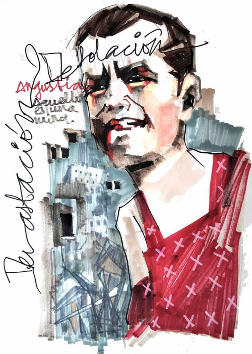
The black cloud