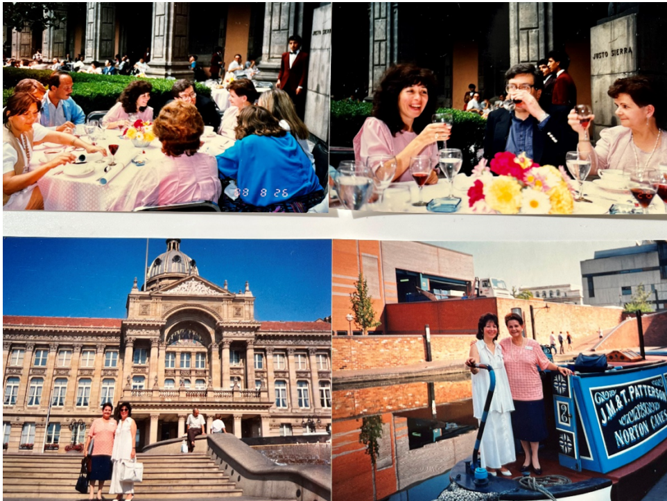
(Fotos del Congreso Literatura Mexicana, San Idelfonso, México, 1988. Con el escritor José Emilio Pacheco. Debajo en Birmingham, 1991)